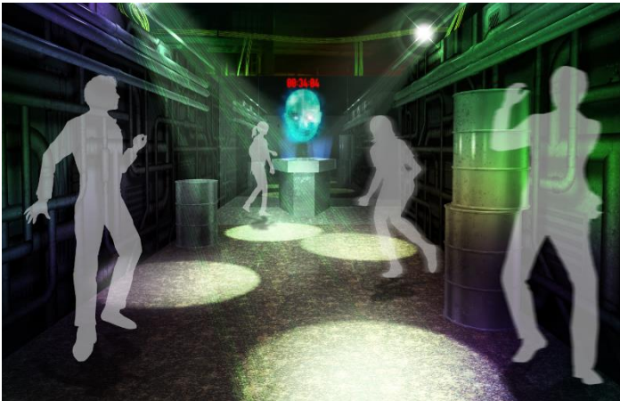
<挑戦者を照らし出すサーチライト>