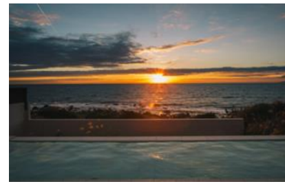
【島の湯からの朝日】