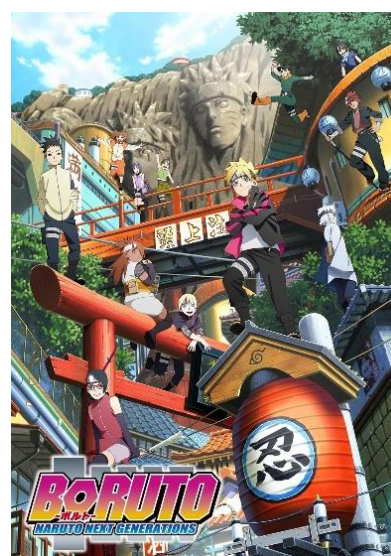
「BORUTO-ボルト- NARUTO NEXT GENERATIONS」 イメージ

また、「BORUTO-ボルト- -NARUTO NEXT GENERATIONS-」は、Vジャンプ（発行：集英社）にて連載されている「NARUTO」のその後を描くスピンオフ作品。里のリーダー“火影”となったうずまきナルトの息子「ボルト」を主人公として、近代化が進んだ“木ノ葉隠れの里”を舞台に物語が描かれる。2017年よりテレビ東京系にてアニメ放送中。