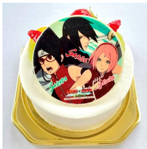
【BORUTO】うちは一家プリントケーキ