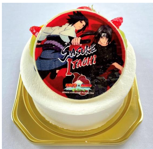
【NARUTO】うちは兄弟プリントケーキ