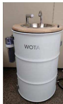
水循環型手洗い機「WOSH」