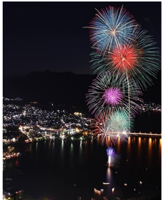
天上山山頂から見る“河口湖冬花火”