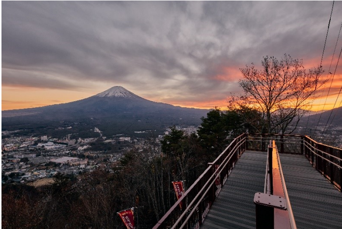
「絶景パノラマ回廊」から見る夕焼け

ロープウェイ山頂の展望広場や「絶景パノラマ回廊」からは、夕暮れ時の真っ赤に染まった空と富士山が織りなす大絶景をお楽しみいただけます。「カチカチ山 絶景ブランコ」に乗って思い切りブランコを漕ぎだせば、雄大な富士山が赤く染まる大絶景にダイブするような特別な体験ができます。