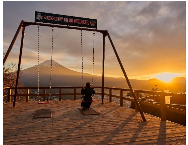
「カチカチ山 絶景ブランコ」から見る夕焼け