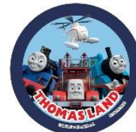
特大オリジナル缶バッジイメージ