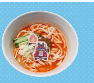
フリンの辛口消火坦々うどん 1,300 円