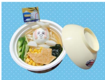
ハロルドの冷やしレスキューうどん (スーベニア丼付き) 1,600 円