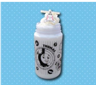
ハロルドのカルピスシェイク (スーベニアボトル付き) 1,000 円