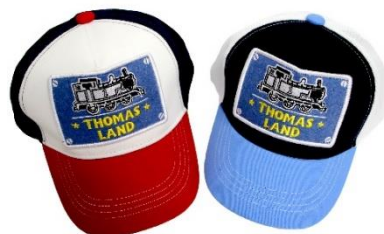
メッシュキャップ 2,400 円

ステーションショップでは、トーマスランドオリジナル「メッシュキャップ」が新登場。熱中症対策にもお勧めです。また、環境に配慮したSDGs商品として、ヒロやニアなどが描かれた竹製の「トーマスバンブーランチプレート」やお片付けにぴったりの「トーマス組立ふた付収納ボックス」など、ご家庭でも活用していただける商品を多数販売しております。