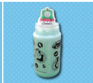
パーシーのメロンシェイク (スーベニアボトル付き) 1,000 円