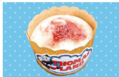
レスキューチームの米粉いちご蒸しパン 350 円