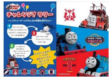
ラリーブックイメージ