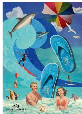
▲ISLAND SLIPPER イメージ