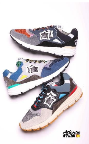
▲Atlantic STARS イメージ