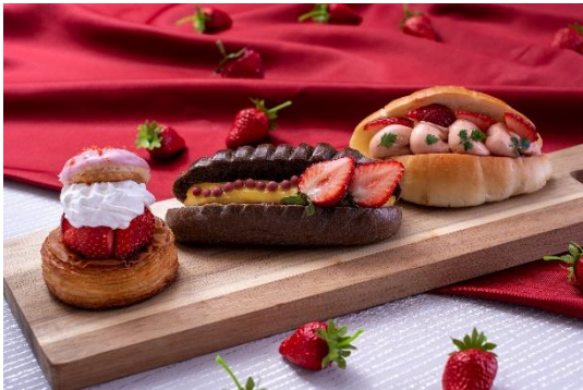
・いちごバター塩パン 340円 ・苺とカスタードのカカオビエノワ 340円 ・苺とホイップのデニッシュ 340円