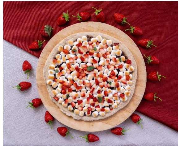
いちごチョコマシュマロピザ 1,800 円