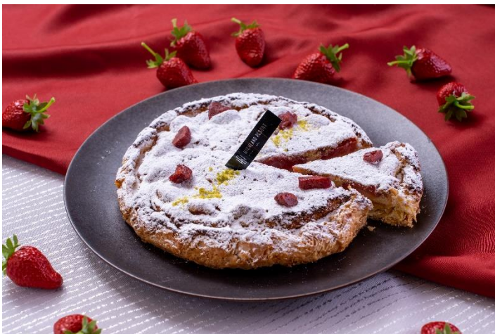
キューイッソ フレーズ 2,000 円

ハイランドリゾート ホテル&スパのイタリアンレストラン「MACARONI CLUB (マカロニクラブ)」では、ぎっしりといちごを並べ、アーモンドクリームと一緒に焼き上げたいちごのパイ「キューイッソフレーズ」などオリジナルいちごメニューを販売し、エリア全体でいちごを存分にお楽しみいただけます。