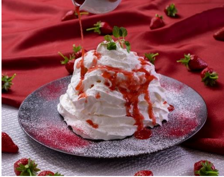
季節の瞬間ショートケーキ(いちご) 1,200円