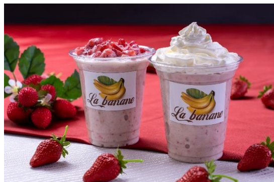
・ストロベリーバナナスムージー(いちご増量) 800円 ・練乳たっぷりいちごバナナスムージー 680円