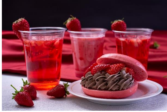
・生イチゴソーダ 650円 ・生イチゴミルク 650円 ・生イチゴサワー 750円 ・イチゴチョコクリームサンド 850円