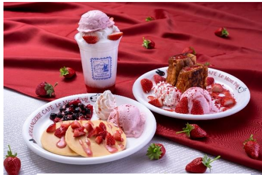
・ストロベリーパンケーキ 1,000円 ・ストロベリーフレンチトースト 1,150円 ・ストロベリーソーダフロート 650円