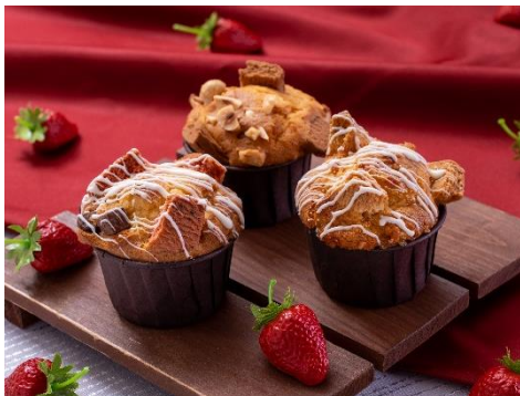
・フジヤママフィン(バニラ) ・フジヤママフィン(ショコラ) ・フジヤママフィン(ストロベリー) 各300円