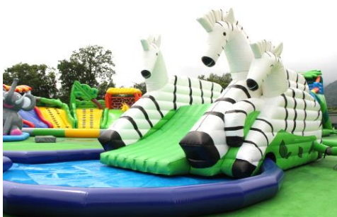
シマウマスライダー