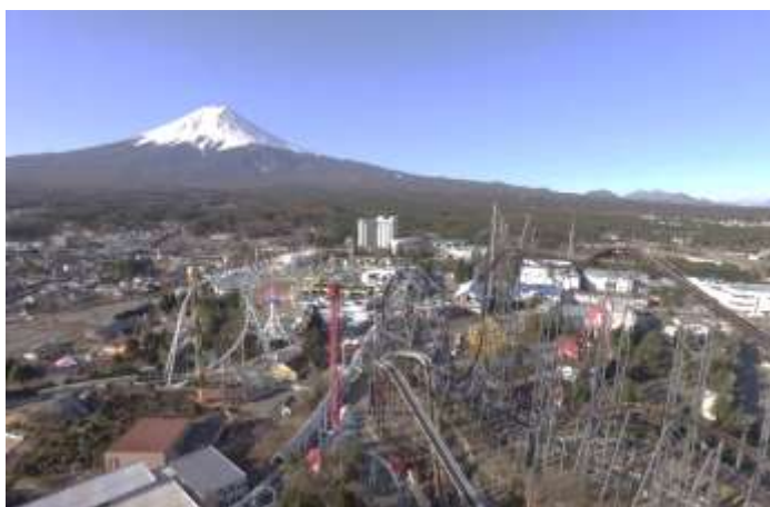
写真:開業当時の富士急ハイランドと近年の富士急ハイランド

入園無料の富士急ハイランド(山梨県富士吉田市)は、その前身である「富士ラマパーク」が1964年7月8日に開場してから、来る2024年7月8日(月)に開場60年を迎えることになりました。富士ラマパークは、先んじて開業していた富士五湖国際スケートセンターに、200分の1のサイズの富士山を再現したハイランド富士、サイエンスホール、わんぱく広場、イベントホール、ゴーカートやボウリングなど幅広い世代が楽しめるエンターテインメント要素と、宿泊施設(ハイランドホテル)が加わり、富士山について学び、楽しむレジャーランドとして現在の富士急ハイランドの前身としてオープンいたしました。