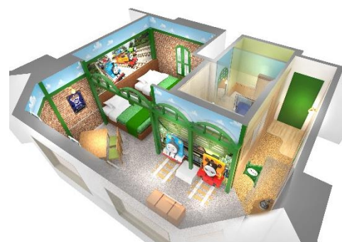
トーマスとニアとナップフォード駅のお部屋 (イメージ)