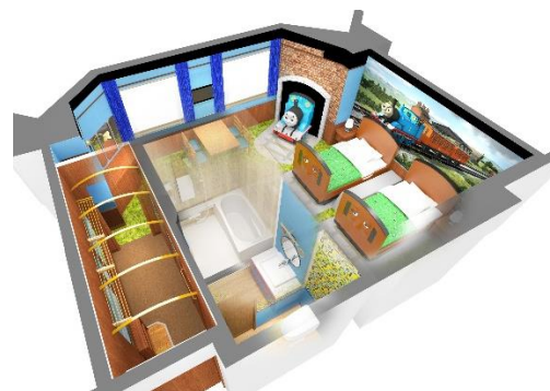
トーマスとアニーとクララベルのお部屋 (イメージ)