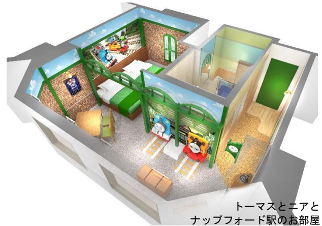
トーマスとニアと ナップフォード駅のお部屋 (イメージ)