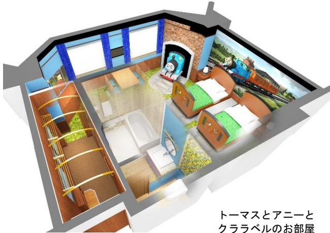
トーマスとアニーと クララベルのお部屋 (イメージ)