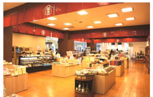
Gateway Fujiyama 富士山駅店