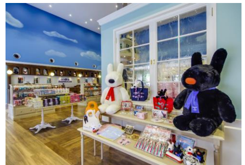
リサとガスパール タウン ショップ