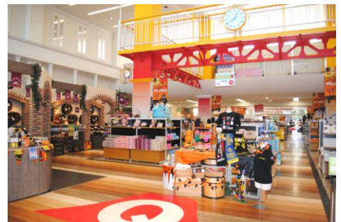
富士急ハイランド ショップフジヤマ

住 所 山梨県富士吉田市上吉田 2-5-1 問い合わせ先 (株)富士急百貨店 0555-23-1111