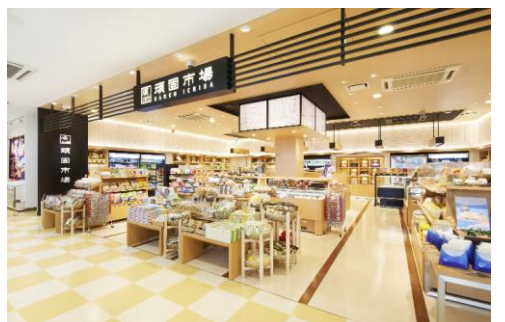
頑固市場富士川 SA 店