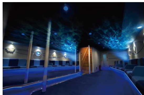
海の中にいるような上甲板下ルーム