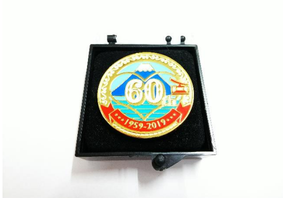
「オリジナルピンズ」700円