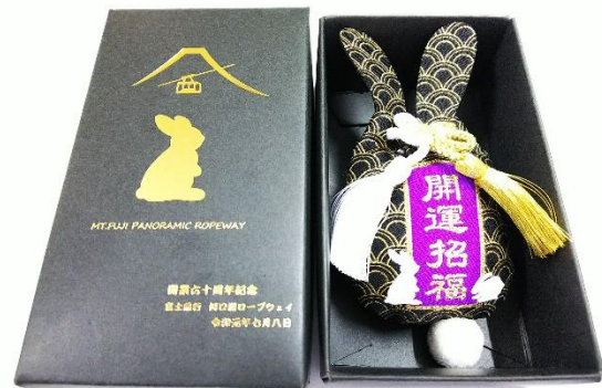
「うさぎお守りプレミアム」1,500円