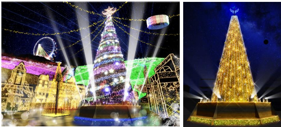
光と音楽の街（イメージ図）

今年初登場するエリア「光と音楽の街」では、高さ15mの巨大イルミリオンツリーを中心に、50万球の光と炎、ドローンが音楽に合わせて光り輝く、これまでにない迫力満点の最新エンタテイメントショーを楽しむことができます。フルカラーLEDで装飾されたツリーとドローンは、特に色鮮やかに輝き、音楽に合わせて色が変わります。(※ドローンの飛行は雨天中止)