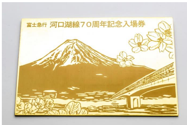
河口湖線開業70周年記念「純金」3駅共通入場券（表）

昨年8月に河口湖線（富士山駅～河口湖駅）が開業70周年を迎えたことを記念して、雪化粧の雄大な富士山と沿線の河口湖大橋、富士吉田市の花「ふじざくら」と富士河口湖町の花「月見草」といった河口湖線沿線の自然の写真を最新のレーザー加工技術によりゴールドプレート上に表現した純金製の入場券です。入場券としては「日本一高い入場券」（※当社調べ）となります。なお、ご購入いただいた方には専用額を贈呈いたします。