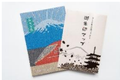
富士急行線御朱印帳 (2,000円)