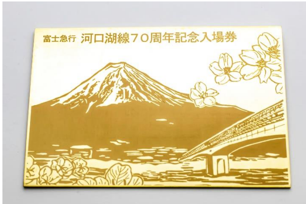
河口湖線開業70周年記念「純金」3駅共通入場券