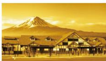
河口湖<富士河口湖温泉郷>駅