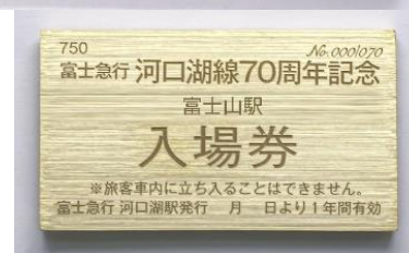
富士山駅入場券(表・裏)