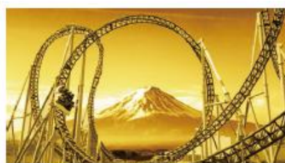
富士急ハイランド<トーマスランド>駅