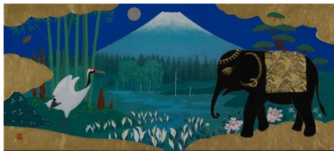
鈴木 強「笑うツルとゾウ」