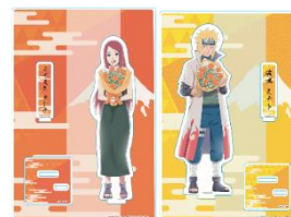
アクリルスタンド ※イメージ